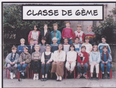
CLASSE DE GÈME