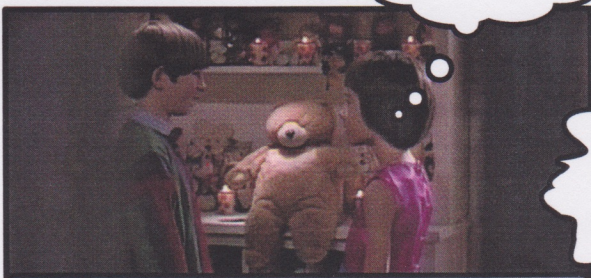
SCÈNE DU FILM "MA VIE EN ROSE"

JE M'INTÉRESSE AUSSI AUX FILLES... EN TANT QUE FILLE